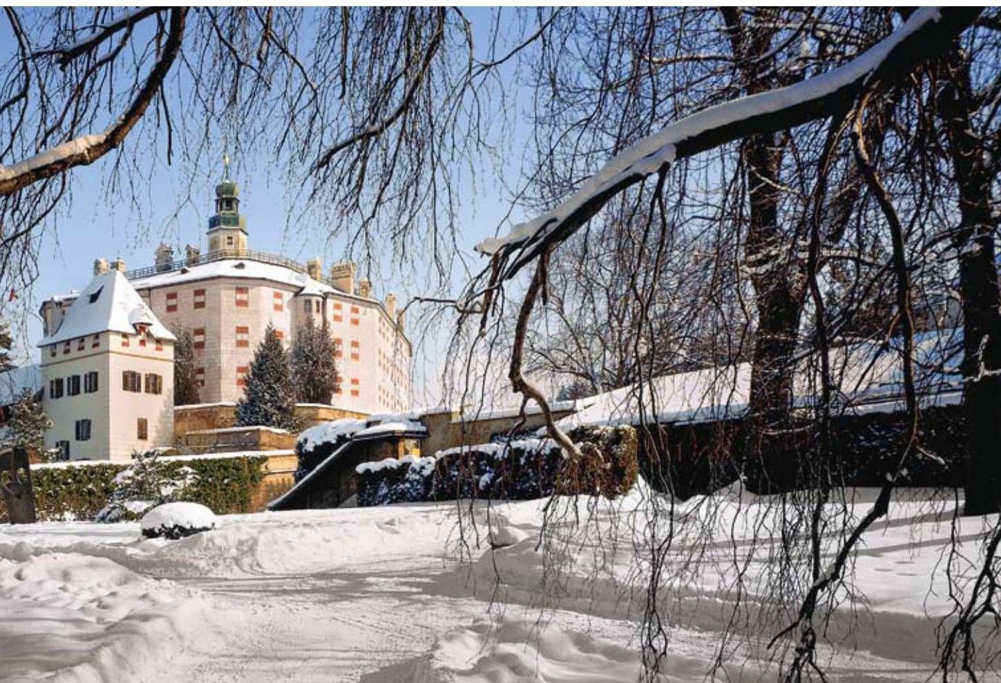
■ Zámek Ambras při pohledu z anglického parku

jeho celý obličej pokrývaly chlupy. Hirsutismem, nadměrným ochlupením v obličejí, byly postiženy také čtyři z jeho sedmi dětí; všichni se stali předmětem lékařského zkoumání. Je pozoruhodné, že sbírka zůstala vcelku a bez úhony. Po smrti Ferdinanda Tyrolského totiž připadl zámek jeho synovi Karlovi, který jej o jedenáct let později prodal Rudolfovi II. „Podivínský císař“ ponechal celou kolekci na původním místě, kde zůstala nedotčena. Část pak byla v důsledku centralizace habsburských