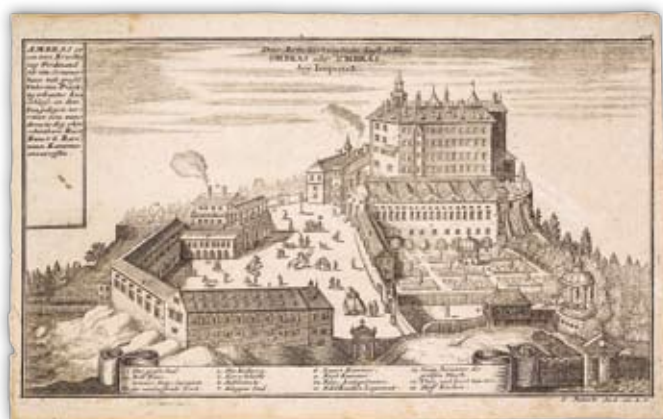
■ Ambras na dobové rytině