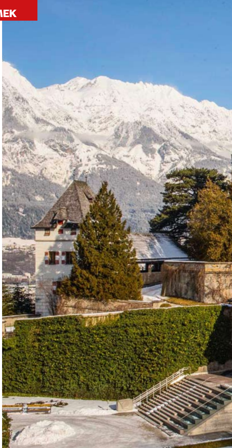
■ Zámek Ambras

roky před Filipíninou smrtí udělil papež manželům výjimku (dispens). Ferdinand ale nikdy svého rozhodnutí nelitoval. Jeho choť představovala ideál krásy. Byla vysoká, štíhlá, měla nesmírně bledou pleť. Vyprávělo se, že když pila červené víno, ostatní viděli, jak jí protéká hrdlem, protože její kůže byla jemná a tenká. Nosila drahé brokáty, sametové šaty a své zlatoplavé vlasy si upravovala do nádherných účesů. Zároveň se vyznačovala inteligencí, dobrosrdečností a Ferdinandovi byla vždy oporou. Vzorně pečovala o domácnost, a když očekávala se svým mužem přátele, sama vaři-