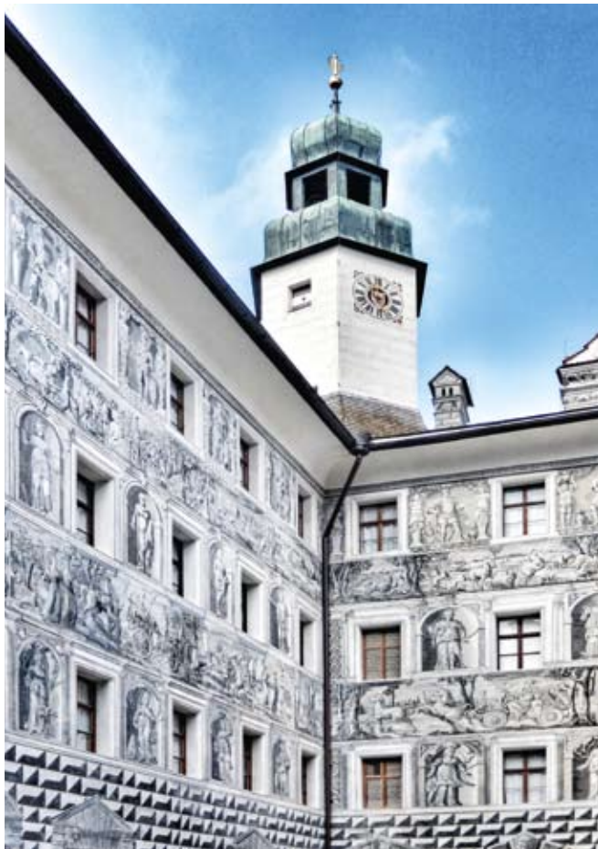
■ Výzdoba vnitřního nádvoří