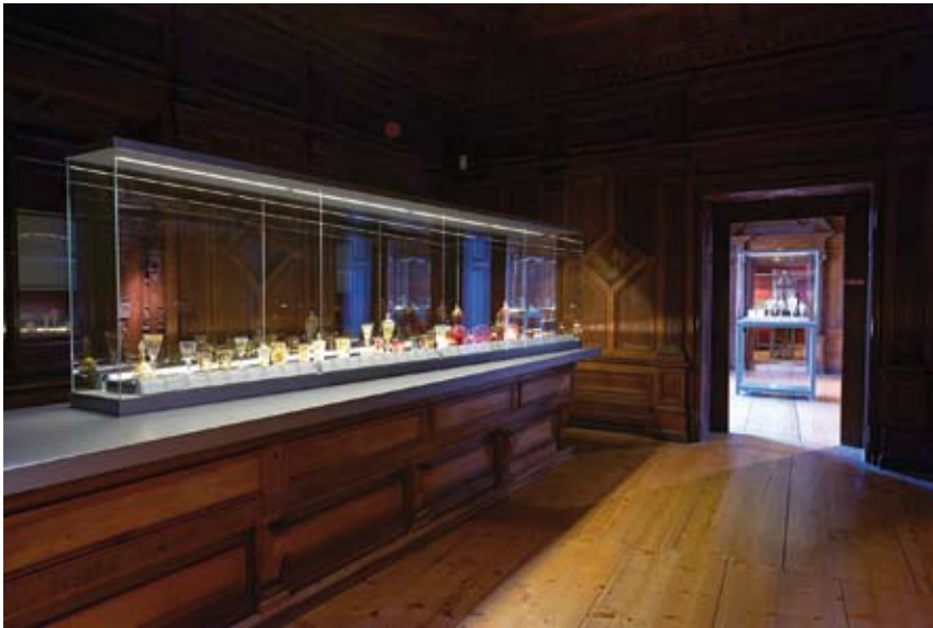
■ Vitrína s poháry, Ambras